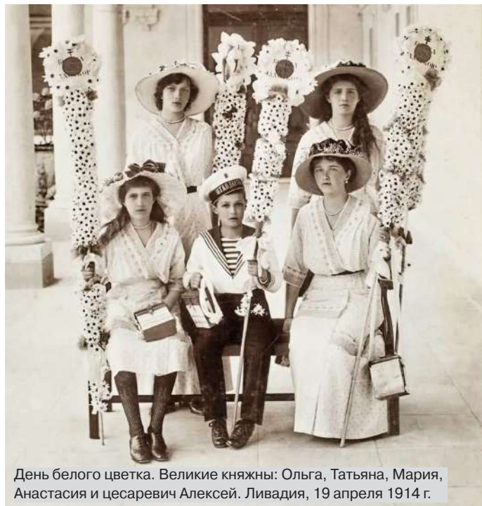
День белого цветка. Великие княжны: Ольга, Татьяна, Мария, Анастасия и цесаревич Алексей. Ливадия, 19 апреля 1914 г.

Каждый благотворительный сбор, в зависимости от направленности, исторически приобрёл свою цветочную символику: