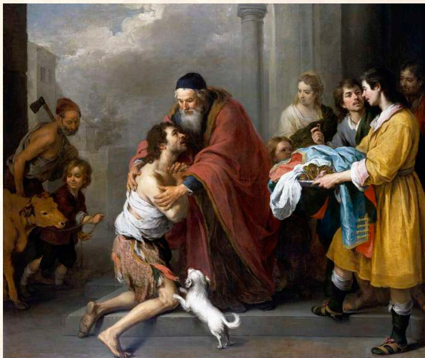
Возвращение блудного сына. Бартоломео Эстебан Мурильо.