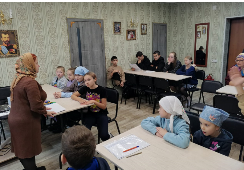
Фото из альбома Воскресной школы