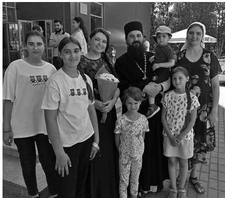
Фото с праздника в г.Стрежевой. ■

Утром в храмах Колпашевской епархии прошли богослужения. Верующие молились об умножении любви и укреплении семейных уз. В тот же день в городах и селах проходили праздничные концерты, во время которых священники епархии поздравляли жителей и обратились с пастырским словом.