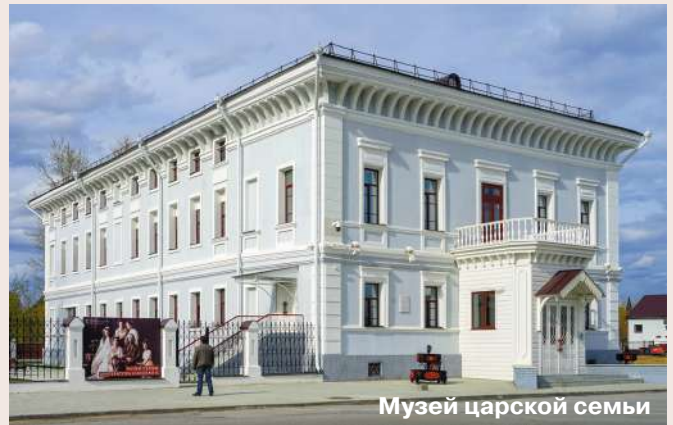
Музей царской семьи

На территории кремля сохранился Архиерейский дом, построенный во второй половине 18 века. До 1918 года он служил резиденцией тобольских архиепископов и митрополитов. С 1925 по 2007 г. здесь размещался Тобольский музей, один из старейших в Сибири. Архиерейский дом овеян тайнами и легендами о секретных подземных ходах, позволивших уйти от ареста красноармейцев владыке Гермогену.