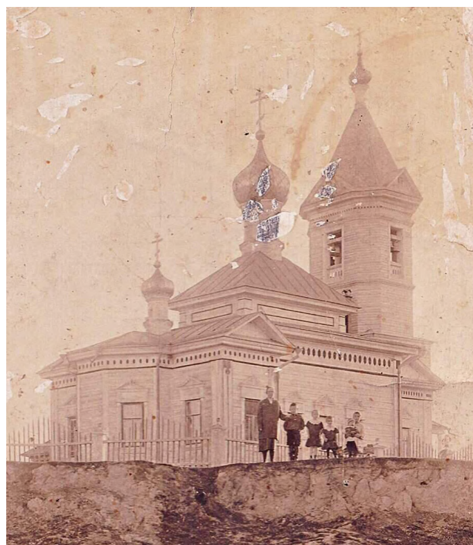
Храм Рождества Христова Пресвятой Богородицы в с.Александровском.

А мы знаем, что благочиние на ровном месте не возникает. Это должен быть дей-