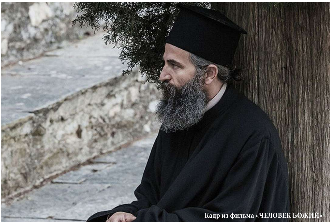
Кадр из фильма «ЧЕЛОВЕК БОЖИЙ»

предательства и клеветы ради Христа. Спасибо. Батюшка, будем ждать с радостью нового просмотра.