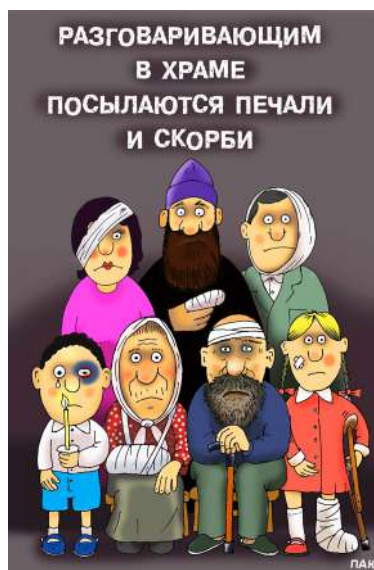
Автор рисунка протоиерей Александр Пономаренко, настоятель Свято-Троицкого храма в Жёлтых Водах Криворожской обл.