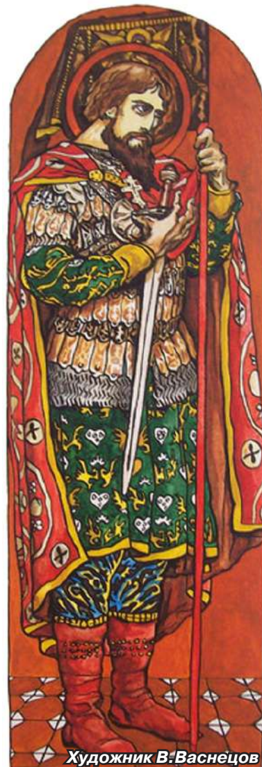
Художник В. Васнецов

Князь Александр Ярославич Невский (1221-1263) в разное время имел титулы князя Новгородского, Киевского, а впоследствии великого князя Владимирского. Прозвище Невский он получил после победы над шведским войском в битве 15 июля 1240 года. Он одержал множество военных побед, а также прославился как политик и дипломат. А.Невский считается покровителем дипломатов.