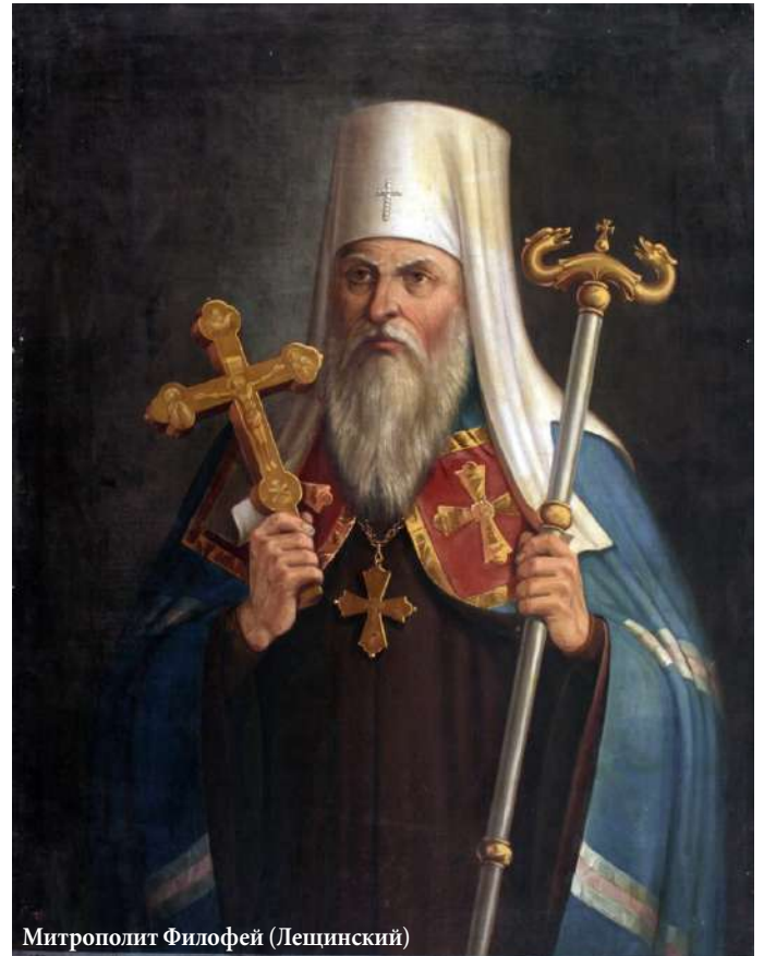
Митрополит Филофей (Лещинский)

Священников в Сибири в те времена, как и сейчас, очень сильно не хватало, поэтому рукополагали в священный сан крестьян и казаков — людей простых и по большей части неграмотных. В исправление этого недостатка была создана митрополитом Филофеем первая в Тобольске славяно-латинская школа для детей духовного звания. Содержалась она за счёт архиерейского дома, а учителями в ней были образованные киевские монахи.