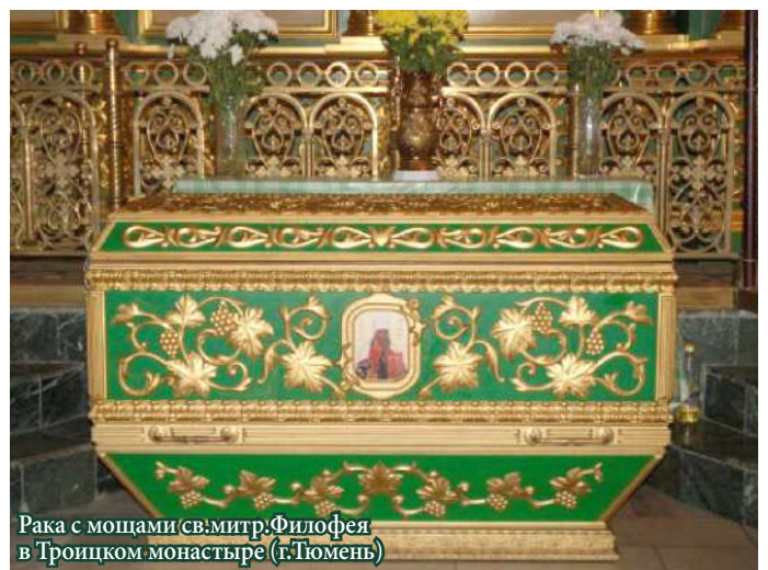
Рака с мошами св.митр.Филофея в Троицком монастыре (г.Тюмень)

Для пропитания сибирского духовенства владыка Филофей исхлопотал у Государя земельные угодья под пашню и сенокосы и установил с прихожан определённую ругу (жалованье хлебом). Не было в церквах хороших